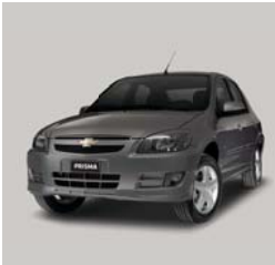
Onium Grey (gris oscuro)