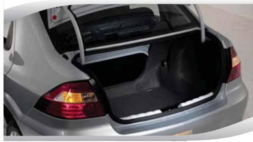
Baúl de gran capacidad.