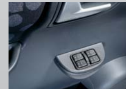
Levanta vidrios eléctricos.