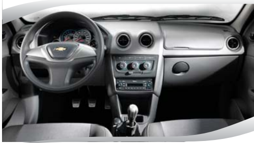
Gran espacio interior.