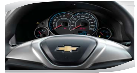
Moderno panel de instrumentos.