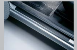
Protector de zócalos.