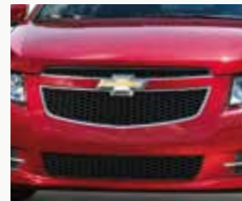
Accesorios Chevrolet Cruze 5

Versión 5 puertas del ícono del nuevo lenguaje de diseño global de Chevrolet, el Cruze es el exponente de una arquitectura y una plataforma completamente nuevas y constituye el lanzamiento más importante de los últimos tiempos para la marca. Cuenta con excelentes dimensiones, un nivel de insonorización superlativo gracias a su estructura, calidad absoluta en sus materiales y terminaciones y un alto nivel de equipamiento que incluye, entre otros: 6 airbags, controles de estabilidad y tracción, frenos a disco en las 4 ruedas con ABS y EBD, sistema de arranque sin llave, techo solar eléctrico, tapizados de cuero y llantas de aleación de 17". Dueño de un diseño innovador, audaz y deportivo, ofrece máxima seguridad a partir de su completo nivel de equipamiento activo y pasivo. Es también tecnología en toda su extensión, ya que cuenta con una arquitectura de información que conecta los puntos críticos del auto con una velocidad que permite controlar en tiempo real todas las funciones. Por otra parte, modernas y eficientes motorizaciones contribuyen a optimizar rendimiento y consumo de combustible.