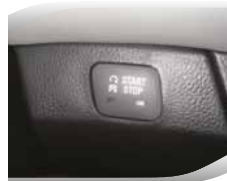
Sistema de acceso y arranque sin llave

Equipamiento correspondiente a versión LTZ.