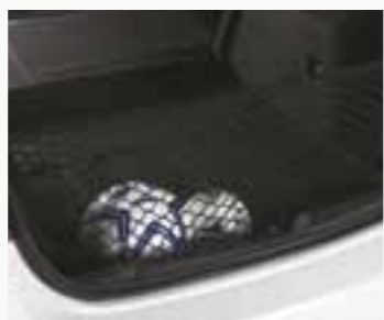
Red sujeta objetos.

Versión 5 puertas del ícono del nuevo lenguaje de diseño global de Chevrolet, el Cruze es el exponente de una arquitectura y una plataforma completamente nuevas y constituye el lanzamiento más importante de los últimos tiempos para la marca. Cuenta con excelentes dimensiones, un nivel de insonorización superlativo gracias a su estructura, calidad absoluta en sus materiales y terminaciones y un alto nivel de equipamiento que incluye, entre otros: 6 airbags, controles de estabilidad y tracción, frenos a disco en las 4 ruedas con ABS y EBD, sistema de arranque sin llave, techo solar eléctrico, tapizados de cuero y llantas de aleación de 17". Dueño de un diseño innovador, audaz y deportivo, ofrece máxima seguridad a partir de su completo nivel de equipamiento activo y pasivo. Es también tecnología en toda su extensión, ya que cuenta con una arquitectura de información que conecta los puntos críticos del auto con una velocidad que permite controlar en tiempo real todas las funciones. Por otra parte, modernas y eficientes motorizaciones contribuyen a optimizar rendimiento y consumo de combustible.