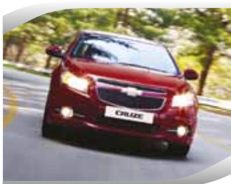
Control de estabilidad y tracción