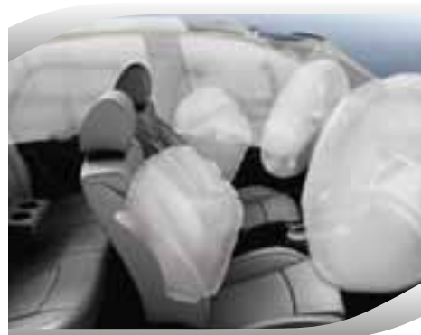
Airbags frontales, laterales y de cortina