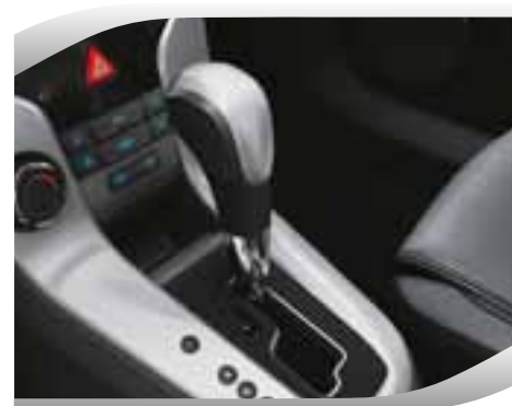
Caja automática secuencial de 6 velocidades