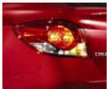
Molduras de faros.