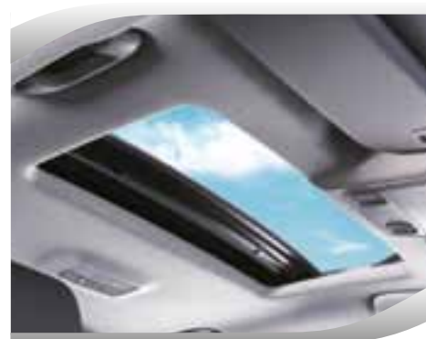
Techo solar eléctrico