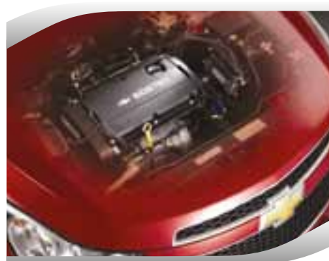
Motor Nafta 1.8 141CV y 16V